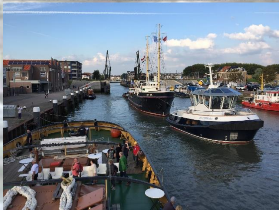
Foto's terugkeer Wereldhavendagen